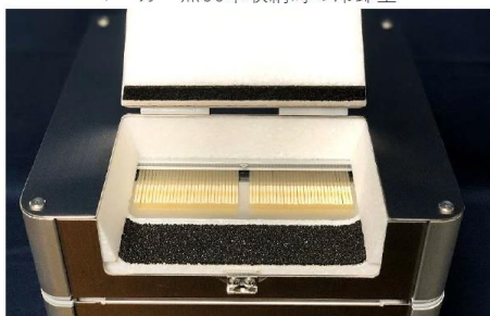
脱着可能な冷却室カバーとストローラック