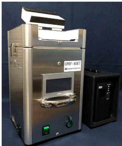
マーカー無60本収納時の冷却室