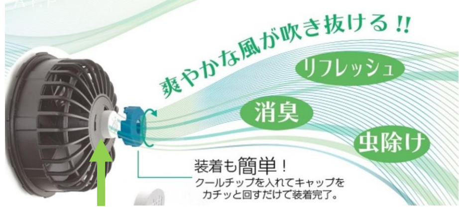
クールチップ; 材質珪藻土

☆クールチップは天然の珪藻土を焼き固めて出来ています ☆効率よく香り水分をきかさせていきます