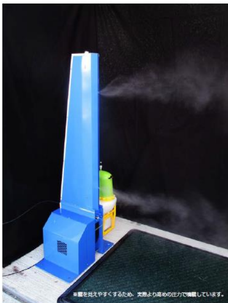
※霧を見えやすくするため、実際より高めの高圧で噴霧しています。