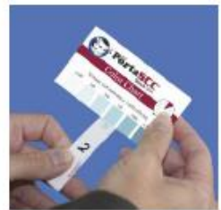
カラーチャートと比較して体細胞数(SCC)を判定