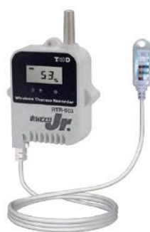
子機 RTR-503 温度、湿度