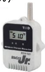
子機 RTR-501 温度のみ