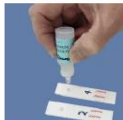
サンプル乳と反応薬を検査紙に滴下