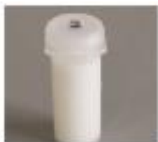
サンプルの生乳を採取