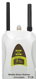
親機 RTR-500MBS-A 携帯網で自動データ送信 ※別途3G回線の契約が必要