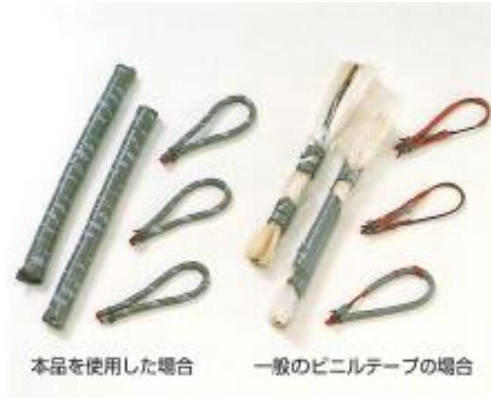
本品を使用した場合