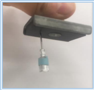
↑一番小さいHD2013も 磁石に先端でくっつきます。

HD針はアメリカ製の 強磁性を持った針です。 金属探知機(食肉用金属探知機 SAFELINE)にて 100% 検出します！